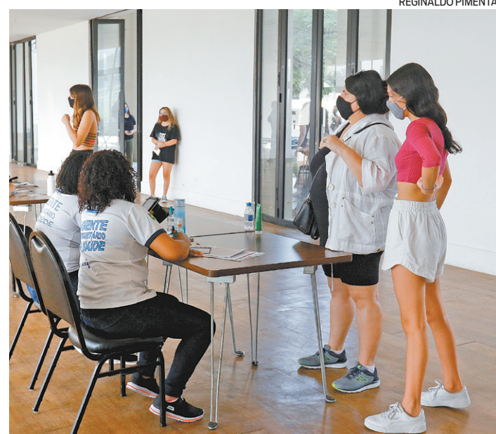
Vacinação de adolescentes segue na cidade do Rio de Janeiro

Ainda segundo o órgão, o Conselho Nacional de Secretários de Saúde (Conass) também discute a questão.